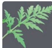
Ses feuilles découpées et vert vif sur les deux faces.