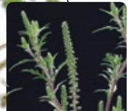
Ses fleurs apparaissent en juillet-août. Elles portent le pollen.